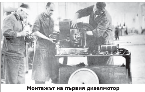
Монтажът на първия дизелмотор

В периода 1944-1947 г. в ДВФ, за първи път в България, са изработени два нови бинокъла с български лещи и призма .