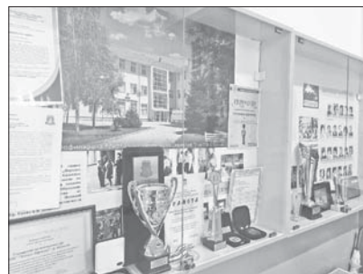
Централното фоайе пази голяма музейна сбирка с отличията, спечелени от възпитаници на гимназията в различни ученически състезания и олимпиади в над половинвековната му история

предвижда една паралелка по-малко прием на нови ученици, поради следване на принципа за поддържане на имиджа на училището като качествено учебно заведение. Една от мерките на ръководството в това отношение е продължаване на политиката на подготовка на свои ученици преди приема след седми клас – практиката показва, че училище тук деца от пети до седми клас имат много по-добра основа за обучение в природните науки, отколкото идващите от други училища. „По-добре по-малко ученици, но по-качествени“, обяснява директорът с удовлетворението, че въпреки трудностите в българското образование с мотивацията на децата, тук, в казанлъшката Математическа гимназия, нивото на обу-