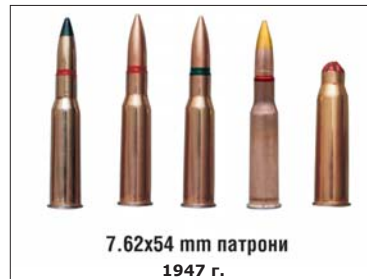
7.62x54 mm патрони 1947 г.

На 10 декември 1948 г. е създадено най-голямото индустриално обединение в българската военна промишленост – Държавното стопанско обединение „Металхим“ , включващо военните заводи в страната.