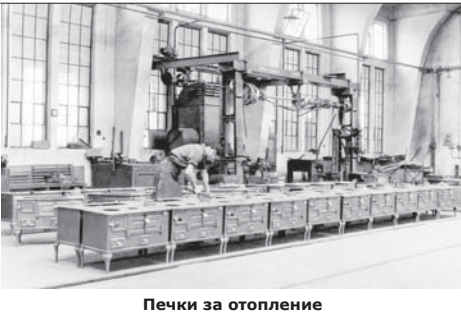
Печки за отопление

били решителни мерки за обновяването и укрепването на военната индустрия.