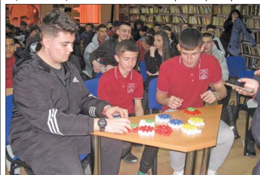
Младите хаджиеновци подреждат пъзела със зъбните колела

професионално образование ДОМИНО, който стартира през 2015 година, като ползотворното взаимодействие