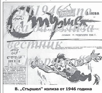
В. „Стършел“ излиза от 1946 година

родна завист към лауреата и се питам – ще бъде ли и аз някога носител на тази висока награда? Годините минаваха, получих я и аз – през 1996-а. А от 20 години, откакто съм главен редактор на вестника и член на журито, аз обявявам поредния носител. Та – превърнал съм се в нещо като „постоянно присъствие“ на Чудомировите празници, те са част от моя живот. Помня различни лауреати, помня някои от наградените разкази, както и смешни случки с колеги и приятели от Казанлък. И най-важното: всяка година влизам в дома на Чудомир, разглеж-