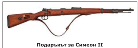
Подаръкът за Симеон II

През август 1944 г. по заповед на Военното министерство, майсторите в казанлъшката ДВФ, ползващи