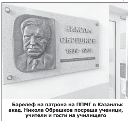
Барелеф на патрона на ППМГ в Казанлък акад. Никола Обрешков посреща ученици, учители и гости на училището

заанлъшката математическа гимназия – една от първите две, открити в България преди повече от 50 години. В средата на учебната година математици, програмисти, физици и биолози се готвят за областни и национални състезания по физкултура през хубавото време от годината. В новия физкултурен салон, където на практика училището ще има за пръв път в над половинвековната си история, ще се очертаят зони за волейбол и баскетбол. „Той ще се оборудва с уреди за нуждите на часовете по физкултура изцяло в рамките на финансирането по проекта, без допълнителни средства“, обяснява директорът. Размерите на спортното съоръжение предвиждат възможност за водене на заниманията на повече от една паралелка едновременно – дължината на закритата площ е 26 метра, ширината – 20 метра, вътрешната височина – 9.5 метра. Салонът ще бъде климатизиран и газифициран. Ще има и две съблекални – за момчета и за момичета, и санитарен възел.