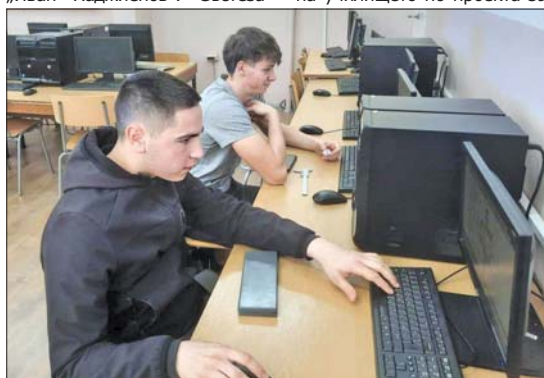
Практическата част от състезанието „Арсенал“ - Дом за ДОМИНО

Хаджиеновци участваха и в Националното състезание „Най-добър техник в машиностроенето“, което се проведе на 16 март в Горна Оряхови-