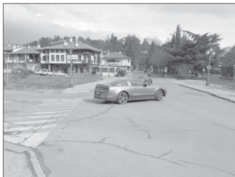
Инвестиции в решаването на проблема с натовареното движение на кръстовището пред хотел „Терес“ са записани в капиталовите разходи на Бюджет '2024 на Община Казанлък

Най-много капиталови разходи са осигурени за поредния етап от канализацията на гр. Крън – над 1 млн. 600 хил. лв. Очаква се одобрение от МРРБ на проект за нова водопроводна мрежа в с. Енина, където се чака и финансиране за физкултурния салон на училището. Такова финансиране се очаква и за с. Хаджи Димитрово. Предвижда се въвеждане на мерки за енергийна ефективност в детската градина в Енина. Сериозна промяна се очертава и в организацията на междуселищния транспорт – по проект ще се купуват нови електробуси, ще се гради зарядна станция за тях и ще се разширява дейността на общинското дружество, което управлява транс-