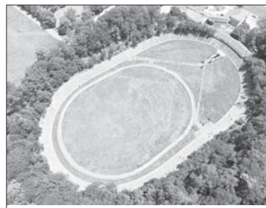
Колодрумът от високо

спортна зала трябва да бъде поставен на много по-голямо,