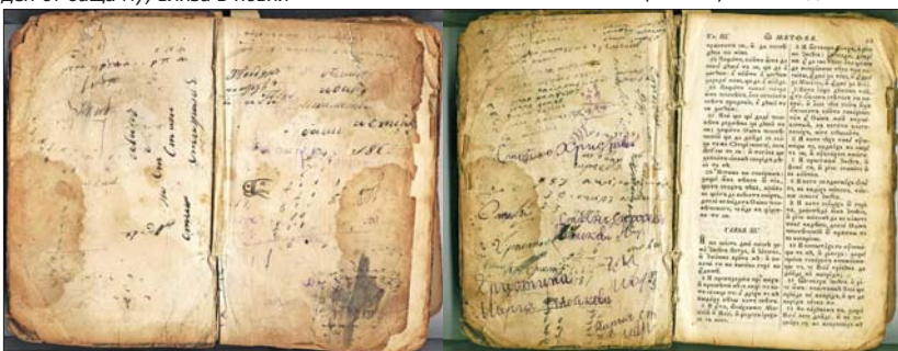
Приписки в четвороевангелие, предавано от поколение на поколение във фамилия Христови, за което се твърди, че е било собственост на Васил Левски