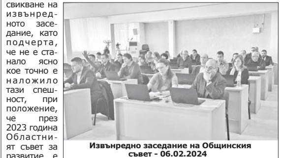
Извънредно заседание на Общинския съвет - 06.02.2024

върди институцията и се постигне по-широка представителност на хората, избрани в местния парламент на Казанлък. И трето – бихме искали да се спазват решенията, взети на Председателския съвет относно датата и дневния ред на заседанията и напълно колегиално да бъдат уведомявани, ко-