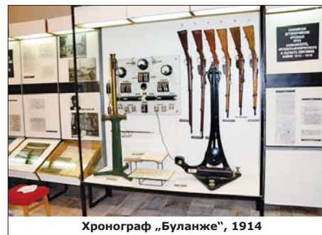
Хронограф „Буланже“, 1914