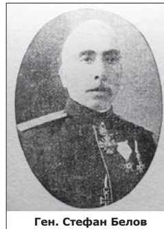
Ген. Стефан Белов

През 1905 г. били започнати нови производства – на патрони, капсули и др. Производството