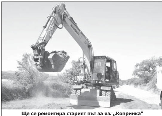
Ще се ремонтира старият път за яз. „Копринка“

запад към момента е рисков поради изключително активното движение на автомобили и камиони покрай разположените до шосето офиси на фирми и производствени бази. До края на тази година там трябва да има кръгово движение.