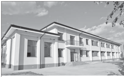
Предстои изграждането на спални помещения към Академията за млади таланти в с. Розово

изток, където индустриалната зона трябва да се свърже инфраструктурно с обхода на града и шосето за Стара Загора и Бургас. Този проект е изчислен на 3 млн. 733 хил. 200 лева.