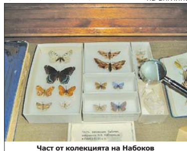
Част от колекцията на Набоков

Творчеството. Набоков публикувал много романи, сред които „Лолита“, „Пнин“ и „Други брегове“, а след връщането му в Европа – и шедьоврите си „Ада“, „Блед огън“ и „Памет, говори“. За творчеството му са характерни оригиналният стил, експериментирането с формата, изкусната игра на думи, страстта му към пряката реч и непредсказуемата развръзка. Писал