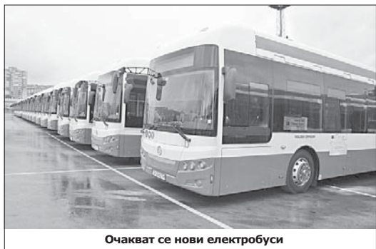
Очакват се нови електробуси

градина на следващ етап – в ОУ „Мати България“ и ОУ „Антон Страшимиров“. Предвиде-