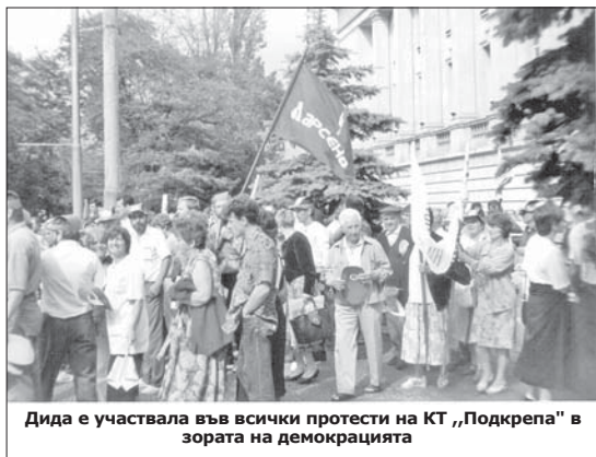
Дида е участвала във всички протести на КТ „Подкрепа“ в зората на демокрацията

работи 22 години – повече от половината на арсеналския си трудов стаж.