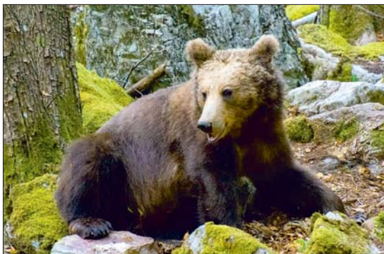
Гради не се страхува от мечки, снимал ги е десетки пъти

и тактики. Йовчев го може. Изучил е всичките навици на мечката – нощното хрупане под джанките /на нощ до 30 кг! / и дневното ровене с муцуна под влажната шума в де-