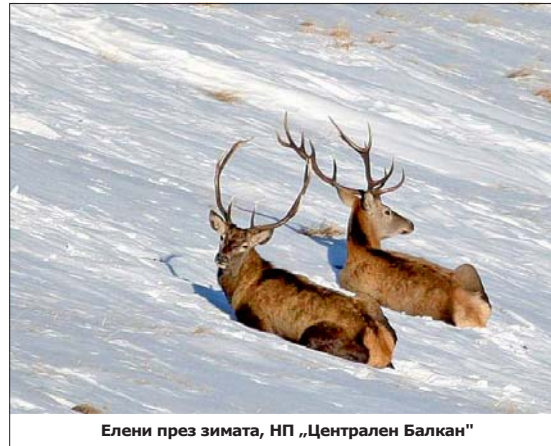
Елени през зимата, НП „Централен Балкан“

ите също бягат от човека. Съзнания и при добра екипировка, опасност на практика