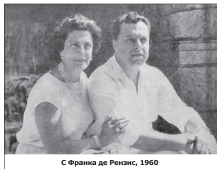
С Франка де Рензис, 1960

През 1976 г. Борис Христов дарил на България къщата си в Рим. След основен ремонт с български средства, в нея била създадена