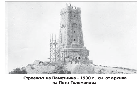
Строежът на Паметника - 1930 г.

ка-Бузлуджа“ има техническо обследване. През ноември с. г. е готов Идеиният проект за ремонт, включващ архитектурна и конструктивна част, електрообзавеждане, интериор, отопление, вентилация, климатизация, планове за пожарна безопасност и управление на строителните отпадъци. Работният проект, описващ всички предстоящи дейности, вкл. благоустройството и оформянето на прилежаща-