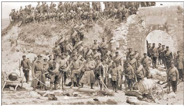
Части от Българската земска войска, 1878

След Освободителната война, 1877-78 г., пред страната ни стояла задачата да си създаде собст-