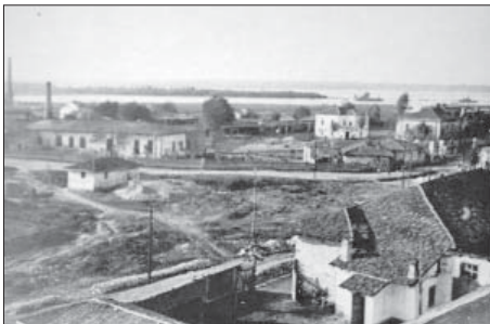
Русенският артилерийски арсенал, 1878

Русенският арсенал укрепвал бързо: били разкрити редица работилници – механична, железарска, ковашка, леярна, дърводелска, бояджийска и сарашка; доставени били нови машини и съоръжения; обучавани били майстори по оръжейното дело. Била учредена техническа библиотека от 460 тома, повечето доставени от Русия. Част от нея днес се