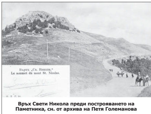
Връх Свети Никола преди построяването на Паметника

Каменните блокове, по 30-40 кг всеки, падат на плочника пред Костницата. Експертна-