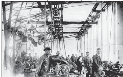
Стругаро-фрезовата работилница, 1879

Почти всички ръководни кадри в Русенския ар-