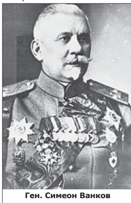
Ген. Симеон Ванков

Работилницата включвала артилерийско и оръжейно отделение и лаборатория. През м. юни 1878 г. от Свищов тя била преместена в Русе – в изоставени турски гробища, а според някои сведения – на територията на кораборемонтния турски арсенал. Съставът ѝ бил от 450 души – офицери, оръжейници, чиновници, шло-сери, ковачи, дърводелци, стругари. Разполагала с много машини, инструменти, резервни части и материали.