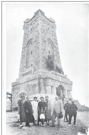
Казанлъчани пред Паметника

„Разговори или намерения за унищожаване, увреждане, преместване, демонтиране, разглобяване или събаряне на Паметника на свободата няма и никога не е имало“, каза за в. „Трибуна Арсенал“ д-р Ангелов. В момента тече процедура по набирането на кандидати за неговата реставрация и консервация, както и за независим строителен надзор, който е задължителен.