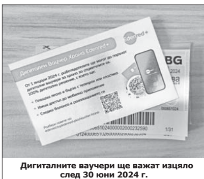
Дигиталните ваучери ще важат изцяло след 30 юни 2024 г.

По информация от Асоциацията на операторите на ваучери за храна в България, работодателите ще могат да дадат на служителите си необлагаеми средства за храна под формата на ваучери за