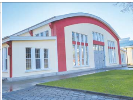
И същата сграда след ремонта

лени, складови помещения, спортни съоръжения и т.н., с най-различна функционалност. Като всяко успешно и работещо предприятие, дружеството непрекъснато се променя – изграждат се нови сгради, други се реконструират, нов облик