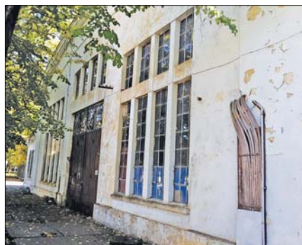
Една от емблематичните сгради в "Арсенал" преди ремонта

фирмите, които имат такъв специалист и проектантски отдел, но „Арсенал“ си е един истински град. Тук има най-разнообразни сгради – административни, промиш-