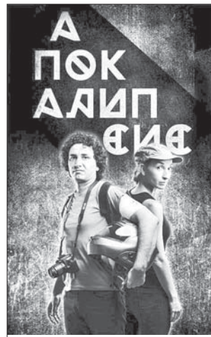
Представяне на кинолентата „Апокалипсис до поискване“

- Не толкова носталгия, колкото желание в българското кино да се появи един „журналистически“ филм. Защото