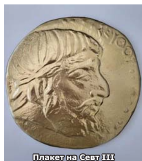
Плакет на Севт III

ни теми – паметникът на Шипка, Хаджи Димитър и други, отдавна