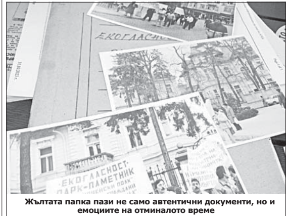
Жълтата папка пази не само автентични документи, но и емоциите на отминало време

която, както и на национално ниво, след няколко месеца, през пролетта на 1990-та, се реструктурира като Политически клуб, с цел участие в предстоящите избори, на което независимите сдружения нямат право. В Казанлък започва организацията и провеждането на огромни митинги, шествия, кръгли маси, протести пред Община-та – тогава Шипковата къща,