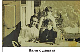
Валя с децата

Буржоазен художник. Платна на Никола Танев притежавали