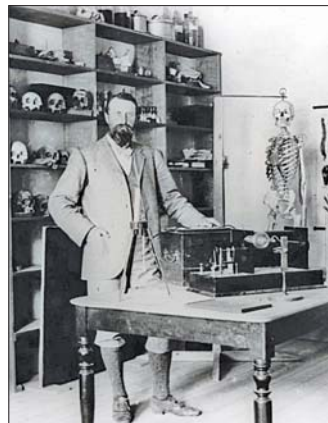
Ръонтген с изобретението си

Научната дейност. Ученият притежавал необикновено чувство за експериментирание. Повече от 50 години той се занимавал с научни търсения. Автор е на над 50 научни труда, най-известният е „За новия род лъчи“. По своите възгледи Вилхелм Ръонтген бил представител на класическата физика. Познавал се с най-известните физи-