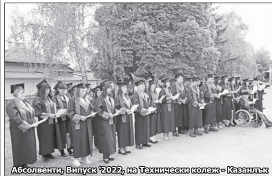
Абсолвенти, випуск '2022, на Технически колеж – Казанлък